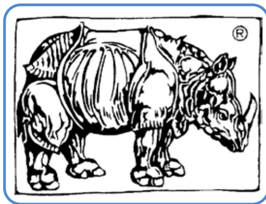
Marchio Arnaldo Forni Editore

Dopo la sua morte, nel 1983, la casa editrice continuò a prosperare sotto la guida della sua famiglia. Negli anni '90, l'industria editoriale attraversò una grande trasformazione con l'avvento del digitale e di internet, ma la Ar-