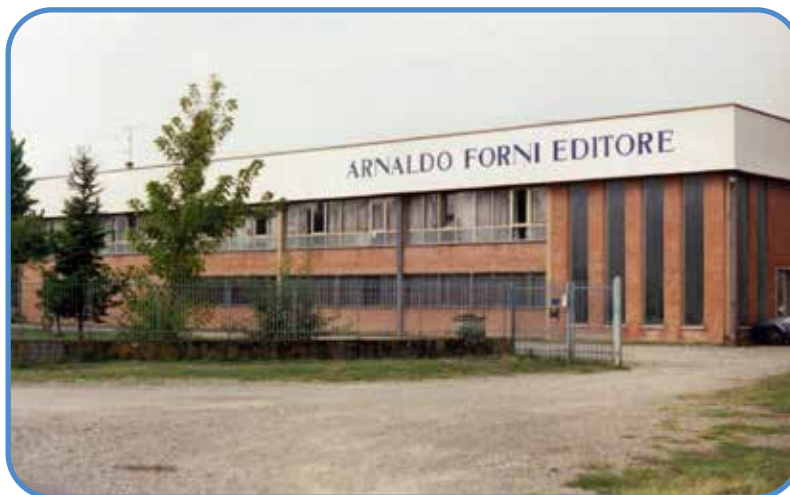
1973 Sede della Arnaldo Forni Editore di Sala Bolognese via Gramsci 164